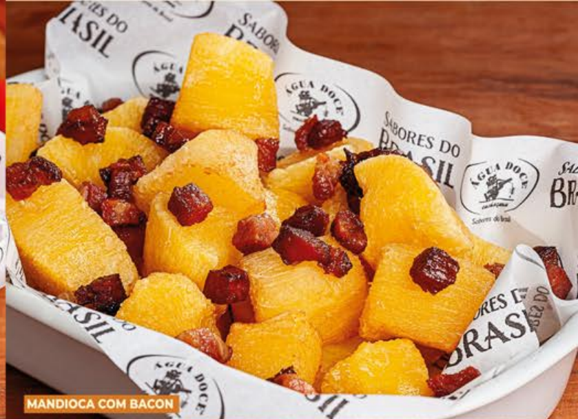
MANDIOCA COM BACON