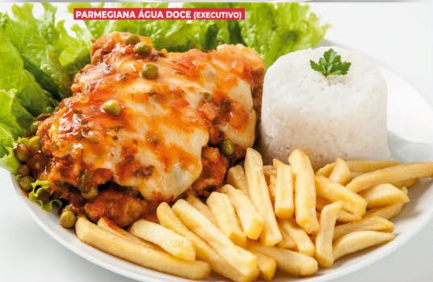
PARMEGIANA ÁGUA DOCE (EXECUTIVO)