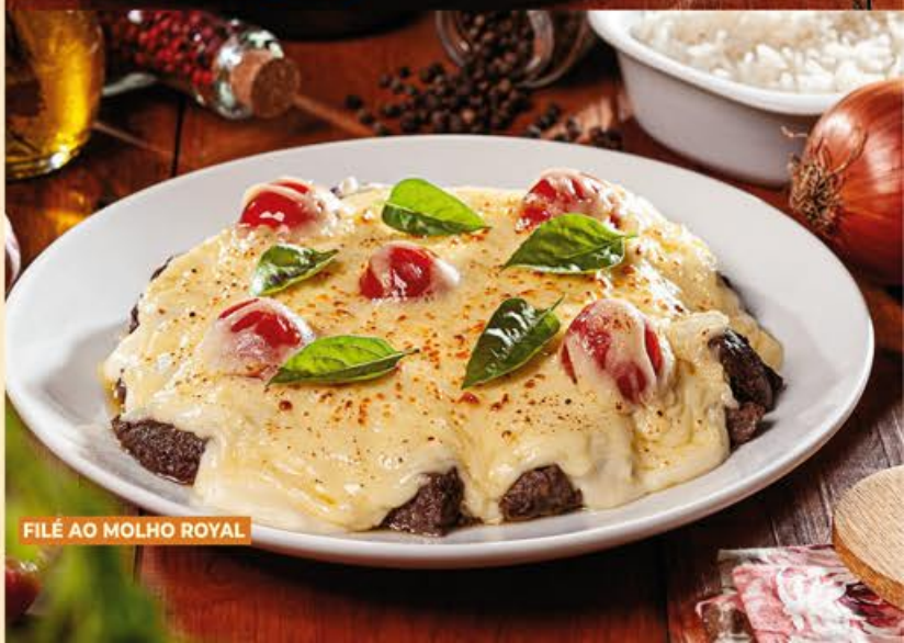
FILÉ AO MOLHO ROYAL