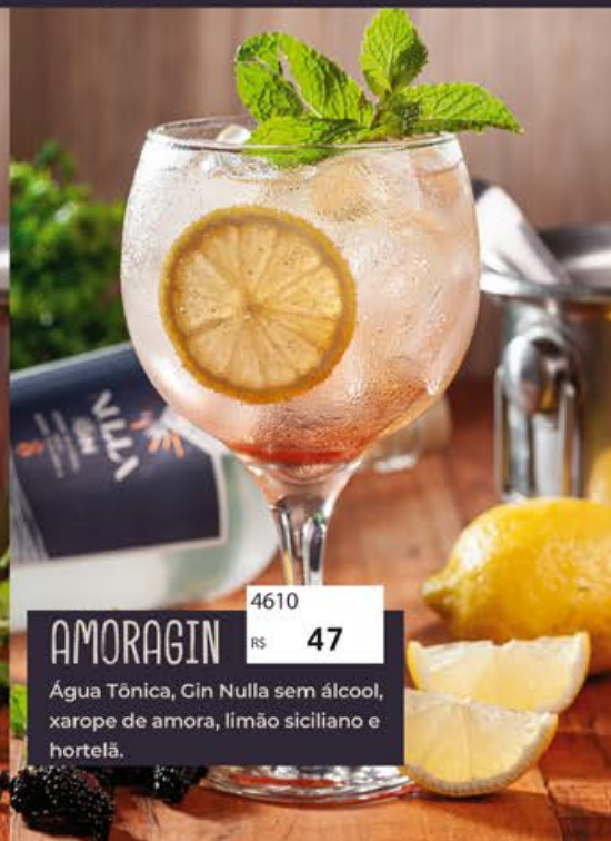
AMORAGIN 4610 R$ 47 Água Tônica, Gin Nulla sem álcool, xarope de amora, limão siciliano e hortelã.