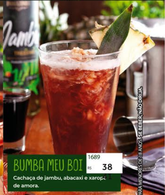
BUMBA MEU BOI 1689 R$ 38 Cachaça de jambu, abacaxi e xarope de amora.