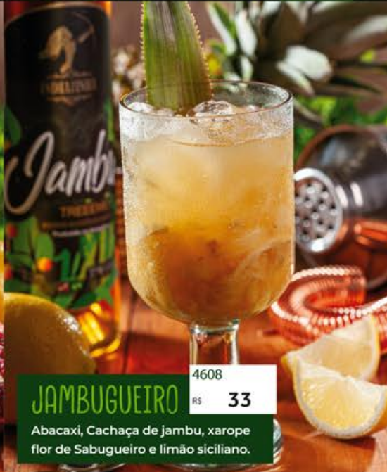
JAMBUGUEIRO 4608 R$ 33 Abacaxi, Cachaça de jambu, xarope flor de Sabugueiro e limão siciliano.