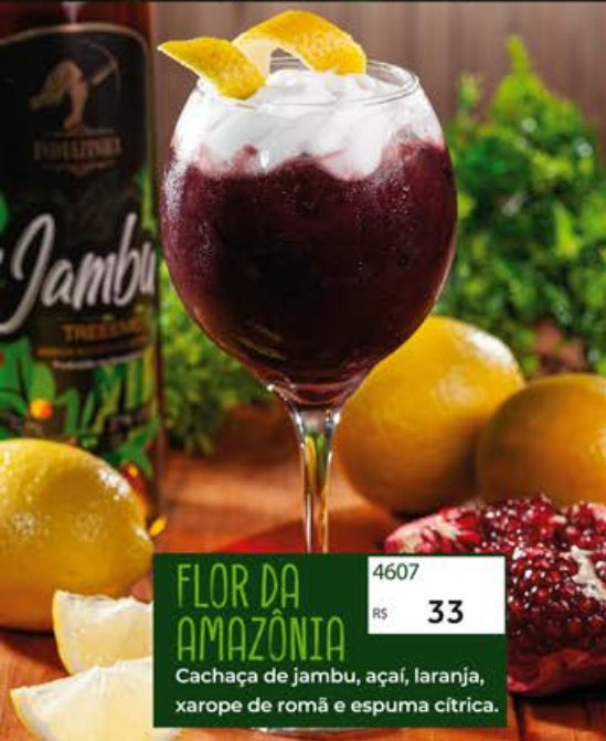
FLOR DA AMAZÔNIA 4607 R$ 33 Cachaça de jambu, açaí, laranja, xarope de romã e espuma cítrica.