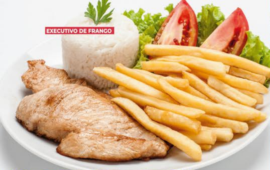
EXECUTIVO DE FRANGO