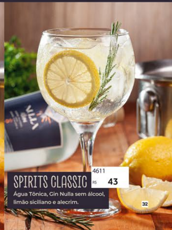
SPIRITS CLASSIC 4611 R$ 43 Água Tônica, Gin Nulla sem álcool, limão siciliano e alecrim.