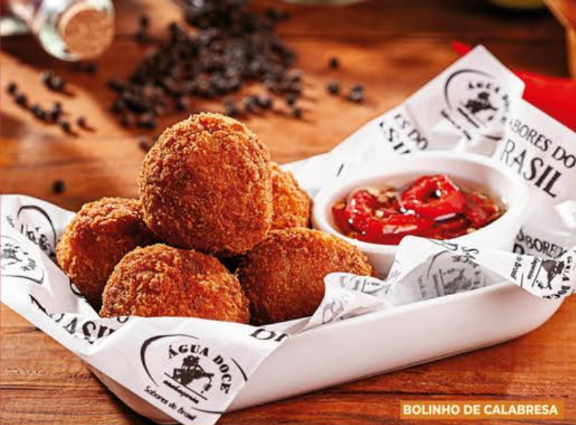
BOLINHO DE CALABRESA