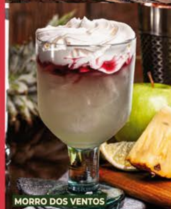
MORRO DOS VENTOS