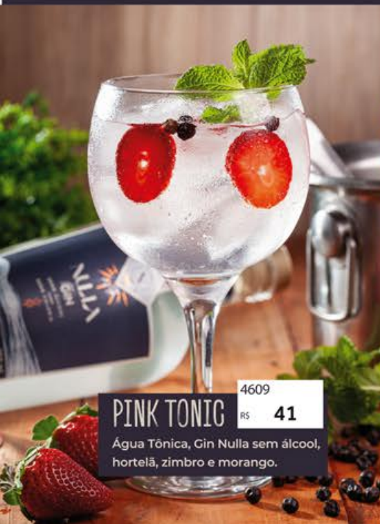
PINK TONIC 4609 R$ 41 Água Tônica, Gin Nulla sem álcool, hortelã, zimbro e morango.