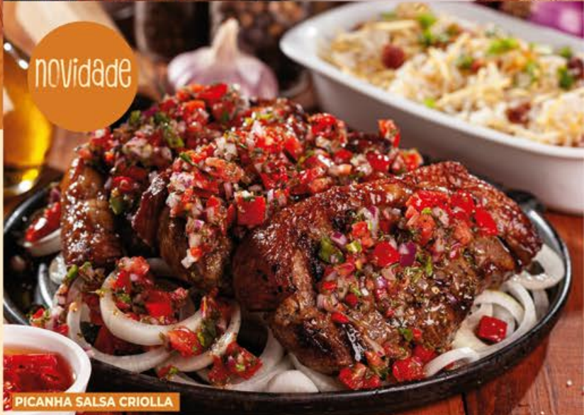
PICANHA SALSA CRIOLLA