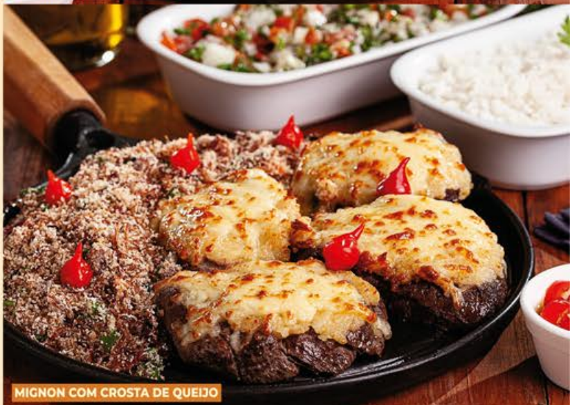
MIGNON COM CROSTA DE QUEIJO