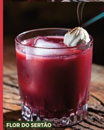
FLOR DO SERTÃO