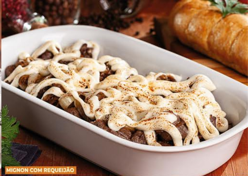
MIGNON COM REQUEIJÃO